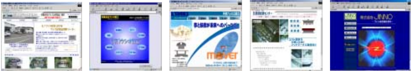
『伊藤プレス型製作所』 『ウシオ精工』 『共栄プレス工業』 『養老技術センター』 『ジンノ』

保全契約をご希望される方は、YJS 技術センター (TEL : 0568-65-1605 渡辺) までご連絡ください。新規ご契約のユーザ様には、インターネット接続手続きのお手伝いを致します。